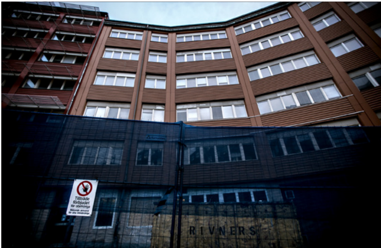
Fabriken på Nordenflychtsvägen ska rivas innan bygget kan starta.

PERSONER har omkommit i bränder i länet under 2014, enligt preliminär statistik. Året innan dog 24 personer. I hela landet har antalet omkomna minskat stort – med 21 procent.