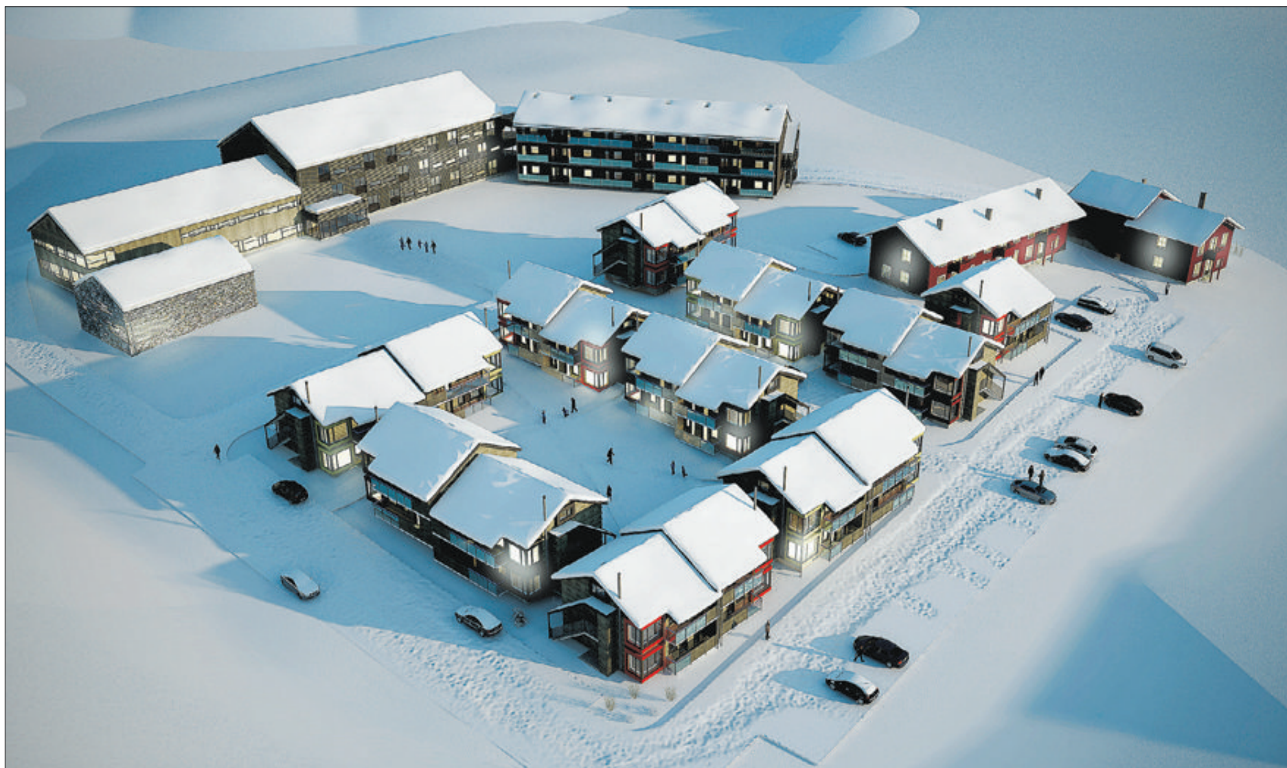
Sveamalm fastigheter AB investerar 200 miljoner i Skivillage-projektet med byggstart nu. Etapp ett beräknas vara inflyttningsklar till våren.