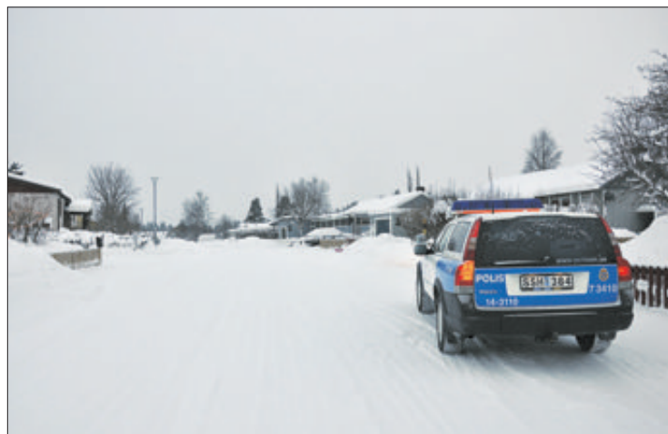
Svegspolisen försökte under måndagsmorgonen få in tips av allmänheten om de tjuvar som gjort inbrott på Loftgatan i Sveg.

Det har under den senaste tiden varit liknande inbrott i närområ-